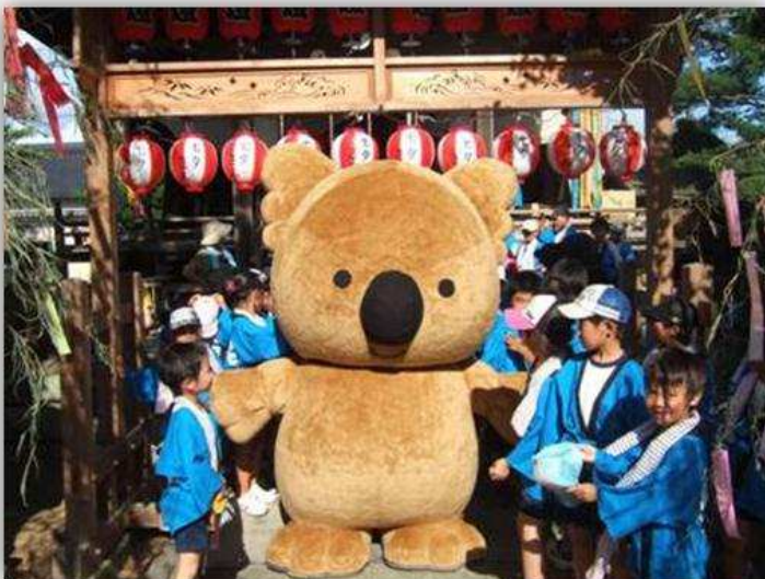
【マーチくんが七夕神社を訪問し、奉納】