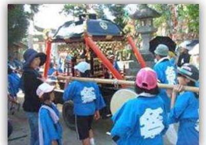
【祈願後、子どもたちは神輿を引いて町内を歩き回ります。】