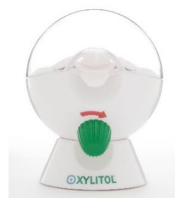
キシリトールサーバー