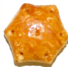
『おおきなパイ飲み』