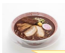
ブラック1杯 ご注文で！