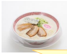
ホワイト1杯 ご注文で！