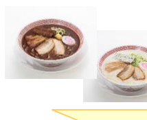
両方同時に ご注文で！