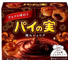
チョコを味わうパイの実 〈深みショコラ〉