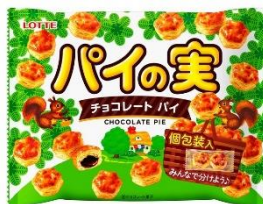
パイの実シェアパック