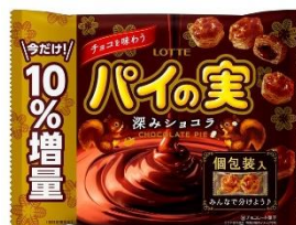
チョコを味わうパイの実シェアパック 〈深みショコラ〉