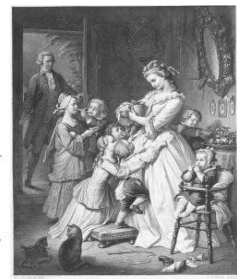
社名の由来である “若きウェルテルの悩み”のヒロイン 「シャルロット」