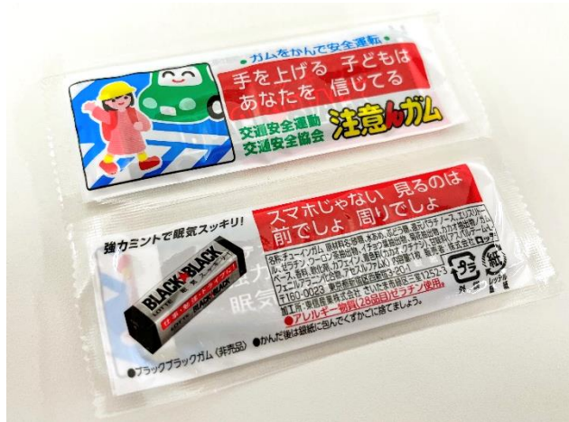
交通安全の標語が書かれた包装を施した ブラックブラックガム（注意んガム）