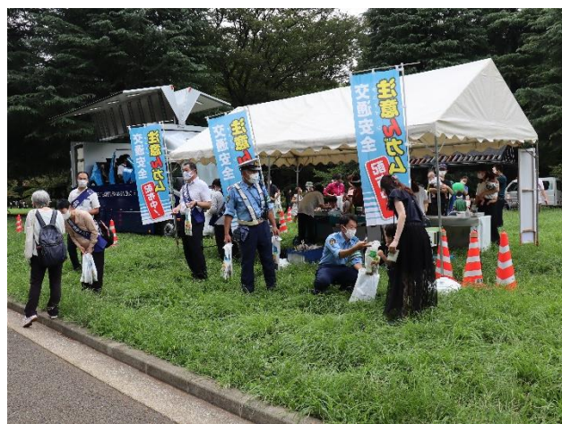
2022年9月3日代々木公園の 交通安全啓発イベントでも配布されました