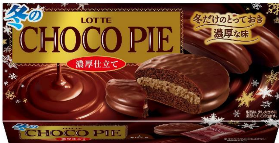
チョコレートケーキ

株式会社ロッテは10月18日(火)に、食べて満足のホッとできる味わい「チョコパイ」シリーズから『冬のチョコパイ＜濃厚仕立て＞』を発売いたします。しっとりとしたチョコレートケーキでカカオ香るチョコレートクリームをサンドし、冬のチョコパイらしい濃厚な味わいに仕上げました。この時期だけの味わいをぜひお楽しみください！