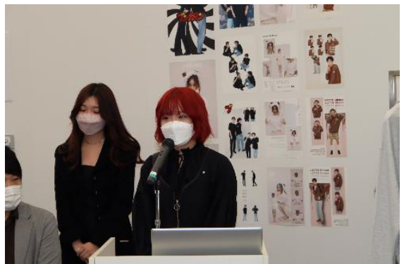
アパレルの説明をする学生