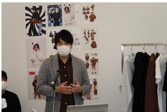
コラボ趣旨を説明するロッテ本原