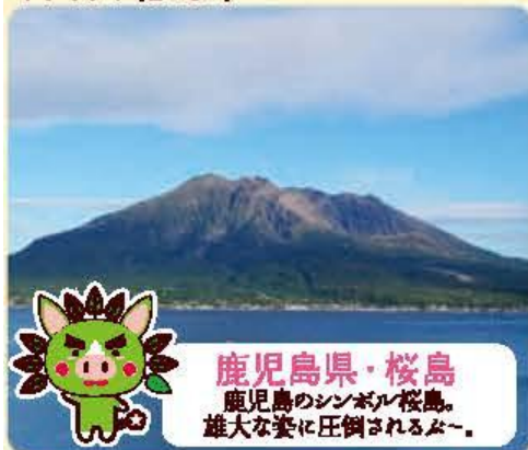
ぐりぶー #188