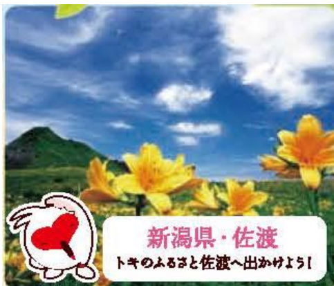
トッキツキ(とっぴー)

手につきにくく食べる場所を選ばない大人のトッポを持って、季節を感じる旅に行こう♪というテーマの下、季節に合わせた全国の観光地をご当地ゆるキャラと共に紹介します。