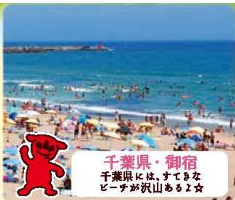
チーバくん 千葉県許諾 第B235-1号