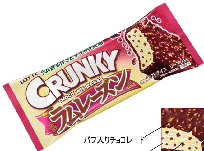
パフ入りチョコレート ラムレーズン風味アイス ラムレーズン