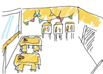
トッポをイメージしたカフェでくつろぎのひとつときをお過ごしください。