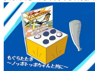
バツのようなノッポトッポちゃん、出てくるモグラを叩きまろう！