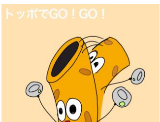
制限時間の中で歩数計でどれだけ歩数を稼げるかを競うゲームです。