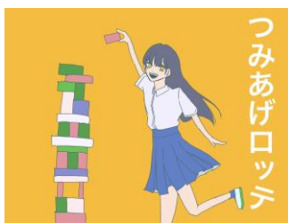
制限時間内にできるだけ高くロツテ商品を積み上げるゲームです！