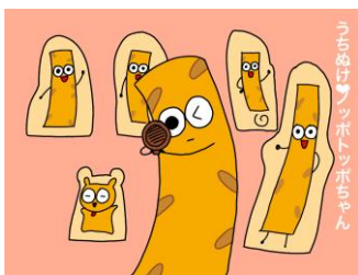
トッポの世界観が楽しめる射的ゲームです。