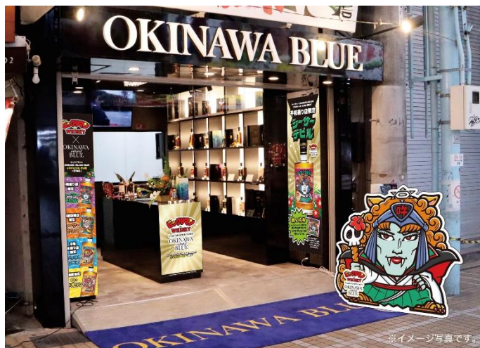
OKINAWA BLUE 平和通り店