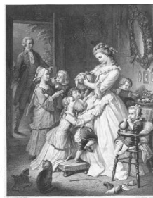
社名の由来である “若きウェルテルの悩み”のヒロイン 「シャルロッテ」