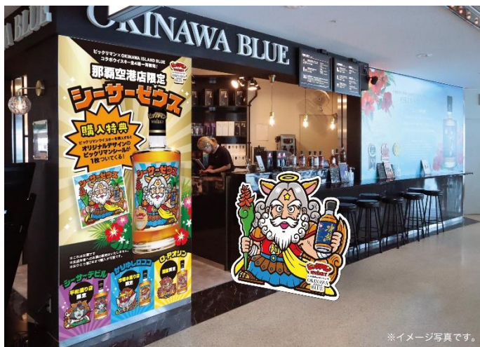
OKINAWA BLUE 那覇空港店