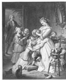
社名の由来である “若きウェルテルの悩み”のヒロイン 「シャルロット」