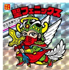
京王多摩センター駅