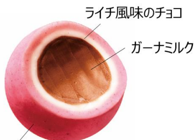
ローズ香るフランボワーズチョコ