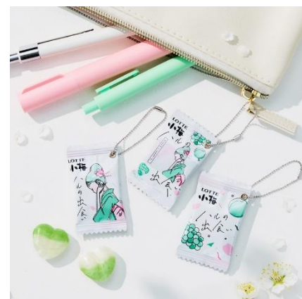
個包装を使ってミニチュアパッケージキーホルダーを作ったイメージカット

キャンディには和歌山県産南高梅果汁を使用し、これまで小梅がこだわってきたあまずつぱい梅の味わいが楽しめることはもちろん、個包装はミニチュアパッケージキーホルダーにリメイクしてもかわいいデザインにしました。「小梅の魅力はキャンディだけではない」ということ、小梅ちゃんの初恋物語を含めて、小梅の世界観をたっぷりお楽しみいただける商品にしました。