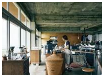
「山の上のロースタリ」店舗内観とレモンのドーナツ