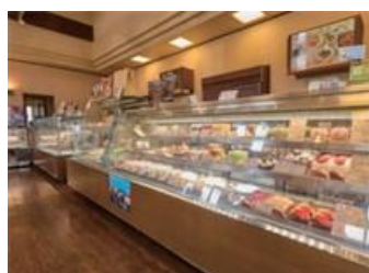
「白いくもの」店舗内観とさくらんぼのショートケーキ