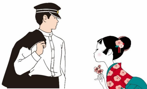
真さんと小梅ちゃん

時代が変わっても「恋する気持ち」は親子、世代を超えて共感できる、変わらないもの。今ではキャンディにとどまらない商品展開で、小梅ちゃんの「恋する想い」をそっと胸に秘めている姿に「小梅」のあまずっぱさを通して、お客様の共感を呼び、長く愛されるブランドになっています。