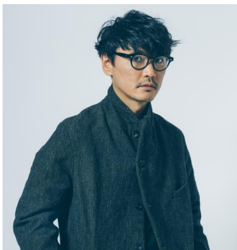
初回ゲスト サカナクション・山口一郎