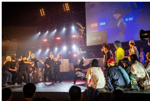
熱気に包まれる「全日本大学ストリートダンス選手権」の様子