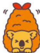
エビフライコアラ