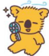
ハンディファンコアラ