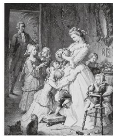
社名の由来である “若きウエルテルの悩み”の登場人物 「シャルロッテ」