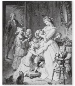
社名の由来である 「若きウェルテルの悩み」の登場人物 【シャルロッテ】