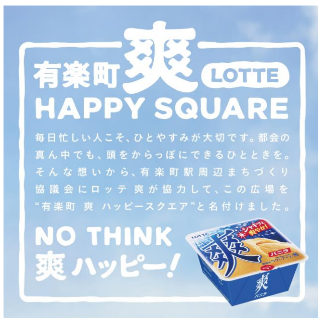
インフォメーションボード