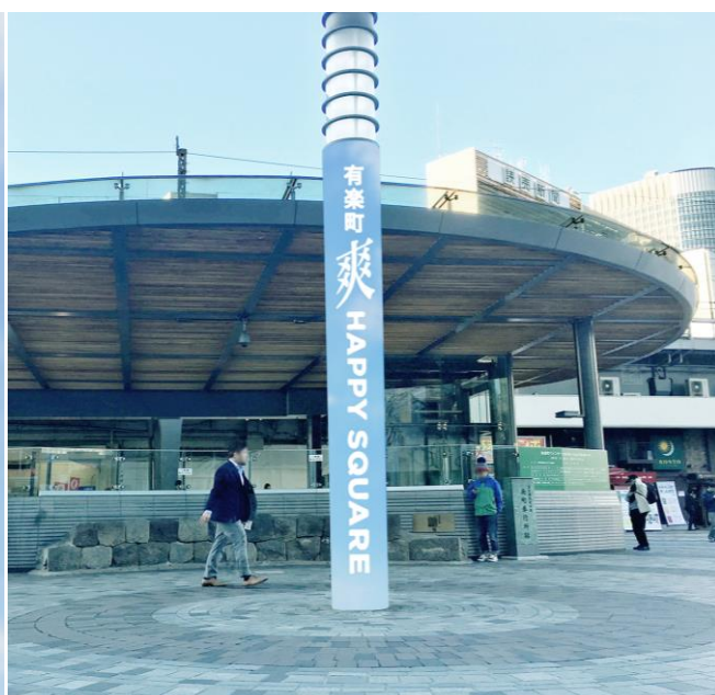
街灯ラッピング広告イメージ

株式会社ロッテアイスは、有楽町駅前広場のネーミングライツを取得し、本日2017年4月10日(月)より、広場の愛称を「有楽町 爽 HAPPY SQUARE」として解禁します。この取り組みは、一般社団法人有楽町駅周辺まちづくり協議会との協業により実現しました。また、広場に愛称が付けられるのは、有楽町駅前広場誕生10年目にして、初めてのことです。