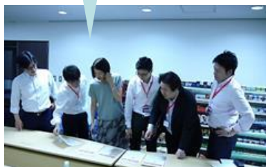
どのアイデアも 雪見だいふくへの 愛にあふれていて

「雪見だいふく」の開発・研究担当者をはじめ、 ロッテ社員が心を込めて選考いたしました。