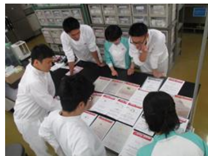
とても嬉しい 気持ちになりながら 拝見いたしました！