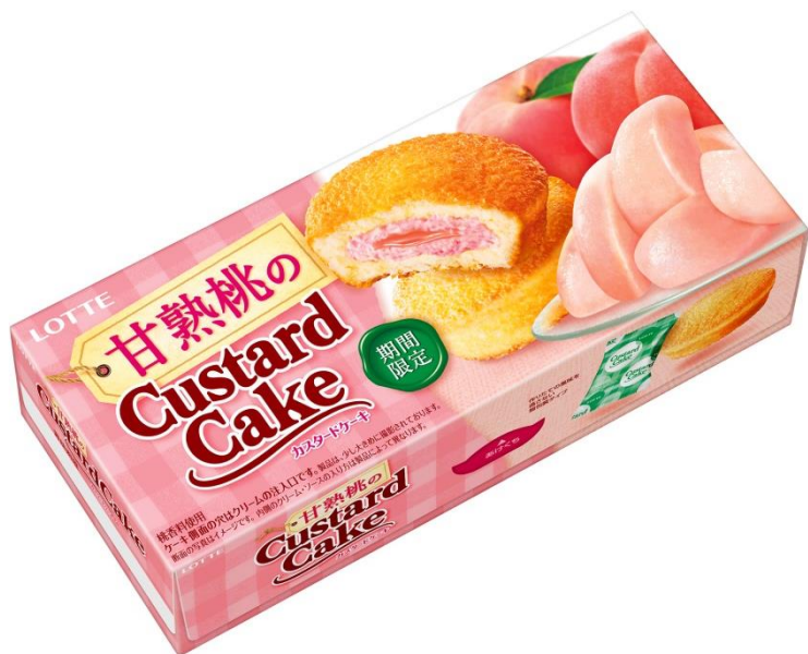
ふんわりカスタードケーキ

株式会社ロッテは1月28日(火)に、「カスタードケーキ」シリーズから春季限定の「甘熟桃のカスタードケーキ」を発売いたします。桃果汁を使用した、甘く熟れた桃の味わいをお楽しみください。