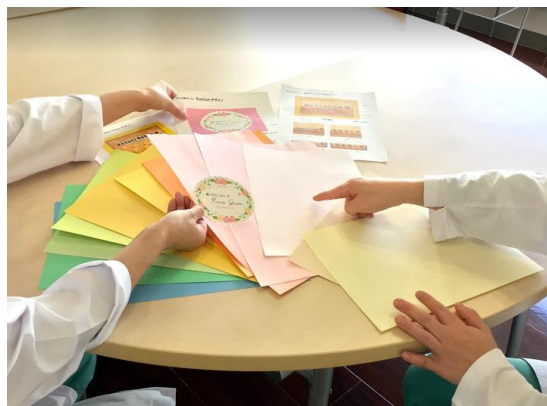
パッケージに使用する紙の色や形、デザインを検討。