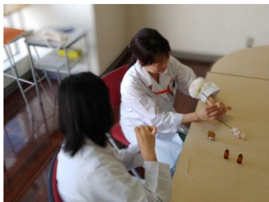
香りについての打ち合わせ。