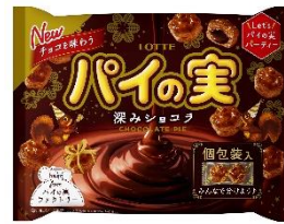
チョコを味わうパイの実シェアパック ＜深みシヨコラ＞

パイの実HPはこちら ⇒ https://www.lotte.co.jp/products/brand/painomi/