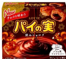
チョコを味わうパイの実 ＜深みシヨコラ＞