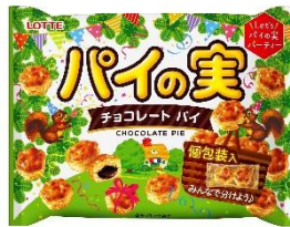
パイの実シェアパック