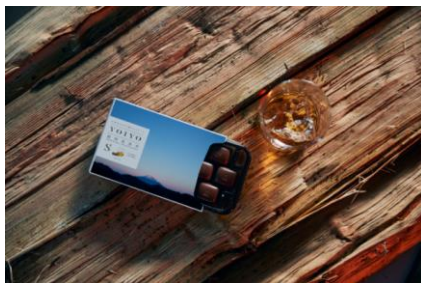
地元の林業会社が敷地内で薪わりをして使用する蒸留器W専用の薪