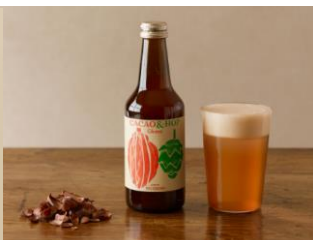
カカオハスクから生まれた アルコール飲料