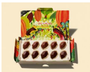
カカオ豆の栽培から携 わって作ったチョコレート