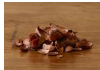
チョコレートの製造過程 で出るカカオ豆の外皮