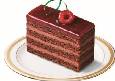
ジョルジュサンド

■ ラ・ヴィエイユ・フランスについて 問い合わせ先 住所：東京都世田谷区粕谷4丁目15-6グランデュール千歳烏山1F TEL 03-5314-3530 店舗URL: http://www.lavieillefrance.jp/