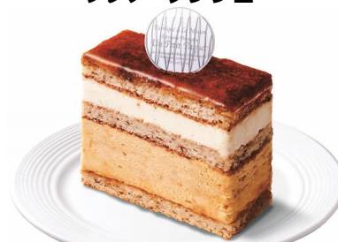
キャラメルバニーク

■ アン・プチ・パケについて 問い合わせ先 住所：神奈川県横浜市青葉区みずすが丘19-1 TEL 045-973-9704 店舗URL: http://www.un-petit-paquet.co.jp/shop/