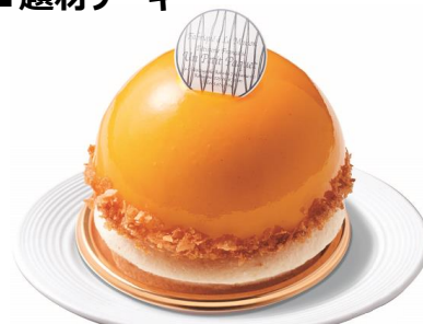
クレメ・ダンジュ