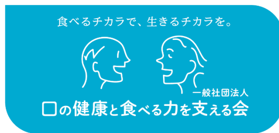
画像右 本会のロゴマークと口腔健康サポーターのロゴマーク