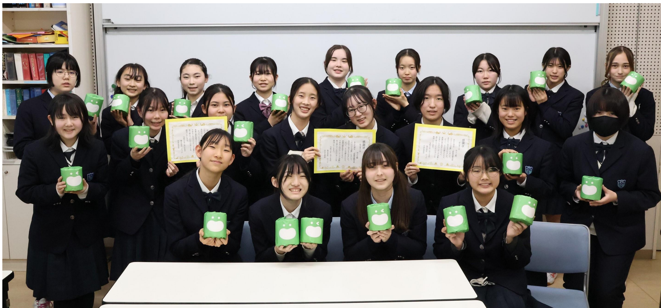
贈呈された「スマイルエコチャレンジ」特別デザインの再生トイレットペーパーを手にするトキワ松学園代表会議の皆さま

株式会社ロッテ（本社：東京都新宿区、以下 ロッテ）は2023年9月からトキワ松学園中学校高等学校（所在地：東京都目黒区）生徒会役員とHR代表委員（以下 代表会議）と協力し、紙製容器包装のリサイクル活動を実施しました。同校内にリサイクル回収箱を設置し、紙製容器のパッケージを回収。古紙再生の専門技術を持つコアレックス信栄株式会社（本社：静岡県富士市）に協力をいただき、同校で回収された紙製容器包装のリターンとして「スマイルエコチャレンジ」特別デザインの再生トイレットペーパーを贈呈しましたのでその模様をご紹介します。また、当社では本件の他にも ガムボトルの容器回収リサイクルの実証実験 を行うなど、容器包装等における持続可能な社会の実現に挑む様々なチャレンジを「スマイルエコチャレンジ」と名付けて実施しています。引き続きステークホルダーの皆さまと共にサプライチェーン全体での持続可能な社会の実現に向けた「スマイルエコチャレンジ」を推進してまいります。