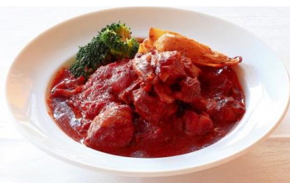
鶏のチョコレート煮込み (チョコレートトマトソース)