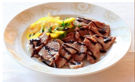
ポークジンジャー (チョコレートジンジャーソース)