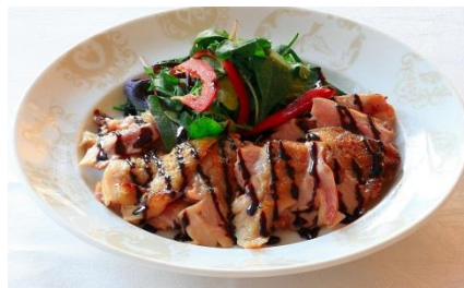
鶏のオープン焼き (チョコレートバルサミコソース)