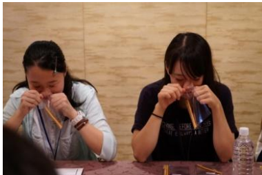
真剣にフレーバーについて考える学生達