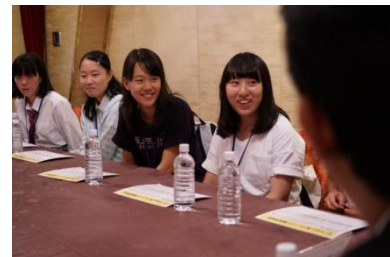
楽しく自分達の学生生活について議論を交わす学生達