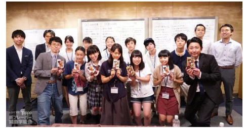
真剣ながらもとても楽しい座談会になりました