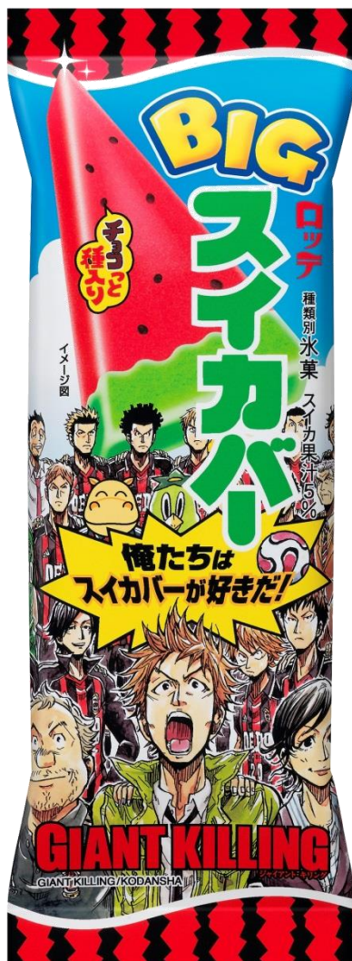
GIANT KILLING / 講談社