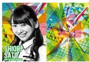
アイドル(欅坂46) 佐藤 詩織

20年後は「大人だけと遊びや可愛げもちゃんとある女性」になっていた。ファッション、ピンク、猫、映画など「今の私」が好きなモチーフたちを使って、そんな理想の「なりたい私」をデザインしてみました。新しい自分に出会う旅に出るような、未来へのワクワク感を感じてもらえたら嬉しいです!