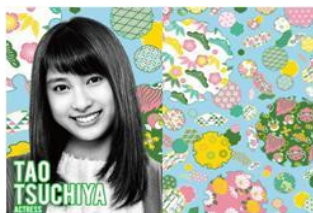
女優 土屋 太鳳

大人も子供も世界中の人がみんな仲良く手を繋いでいる。そんな平和な世の中を、未来というテーマを元にイメージし、架空の国旗モチーフを使って、表現してみました。