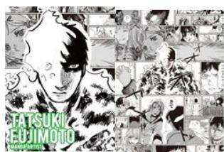
漫画家 藤本 タツキ

女の子2人が穴から覗き込んでいて、真ん中のスタートボタンを押すと、未来の世界が動き出す、そんな世界観をイメージして、デザインさせてもらいました！