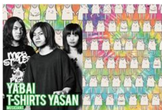
3人組自称メロコアバンド ヤバイシャツ屋さん

ヤバTのオリジナルキャラクター、タンクトップくんが喜怒哀楽様々な表情をしています。ガムはどんな気分の人に食べても楽しい食べ物だと思うのでそれをイメージしてこのデザインにしました。ヤバTらしく良い意味でうるさく、エネルギーなデザインに仕上がりました！