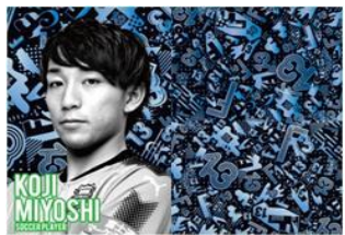
プロサッカー選手 三好 康児

未来に向けて、全ての技術をレベルアップし、マリーンズの顔として活躍する選手になりたい。「13番」といえば平沢といわれる、球界を代表する選手になりたいという気持ちをデザインに込めました。