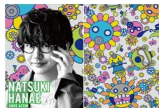
声優 花江 夏樹

魔力高まるキシリトール！甘い間に吸い込まれるようなデザインにしました。じゅる。溶け合います。甘い間の中で永久に、