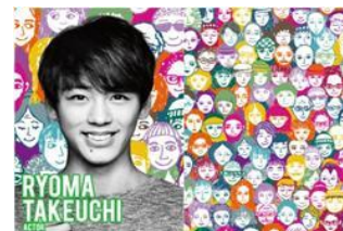
俳優 竹内 涼真

キシリトールが20周年を迎えるということで、おめでたくて華やかなデザインにしたいなと思い、めでたきの象徴である吉祥文様を散りばめました。私の大好きな和柄の魅力をもっと同世代の人に知ってもらいたいなという思いもこもっています。