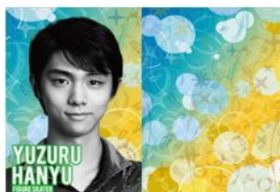
フィギュアスケーター 羽生 結弦

ロッテ「キシリトールガム」と新たな未来をつかっていく若者20組が決定しました。様々なジャンルから選定した彼らと、新しい可能性に挑戦します。それぞれがデザインに込めた思いをご紹介します。