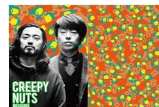
ヒップホップユニット

欅坂46としての自分と美大に通う自分。不安もあるけど、すごく希望に満ちあふれている。そんな自分の今のキモチを欅坂46の三角形のマークをモチーフにスタイリッシュにデザインしてみました!ぜひ見つけてみてくださいね!