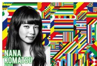
女優・モデル 小松 菜奈

名前の「羽生」から未来にはばたく「羽」と金メダルの「金」をモチーフに、フィギュアの衣装のようなデザインにしました。