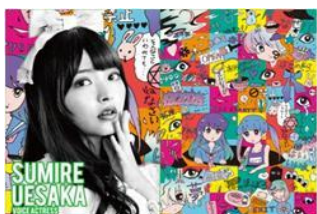
声優 上坂 すみれ

女の子2人が穴から覗き込んでいて、真ん中のスタートボタンを押すと、未来の世界が動き出す、そんな世界観をイメージして、デザインさせてもらいました！