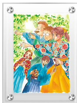
※実際にはサインが入ります。