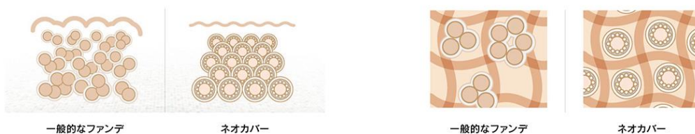
一般的なファンデ