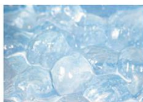
加水分解コラーゲン*6