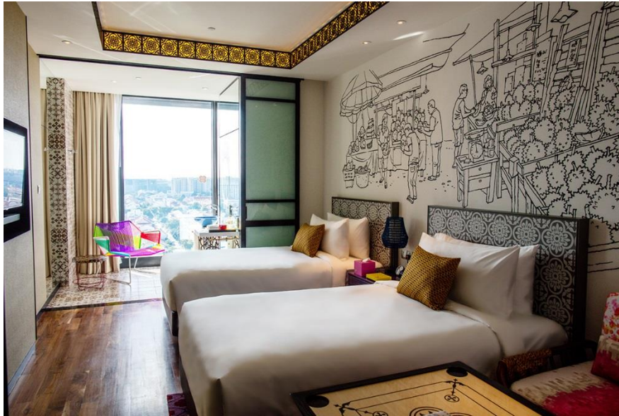
写真：ホテル インディゴ シンガポール カトン（デラックスルーム）

IHG 東南アジア・韓国地区オペレーションズ担当バイスプレジデント、リアン・ハーウッドは、次のようにコメントしています。「旅慣れた上級者のお客様を中心に、他にない個性的な旅へのニーズが近年増えつつある中、それぞれの旅行先本来のいきいきした魅力を体験できるホテルへの需要も高まっています。体験型の旅行需要の獲得を狙いとするブティックホテルはシンガポールでもコンスタントに増えており、世界のホテル市場の約5パーセントをブティックホテルが占めるまでになっています。IHGが昨年オープンしたタイ第1号のホテル インディゴも成功を収めており、ここシンガポールでも、ホテル インディゴ シンガポール カトンがお客様の人気を集めるものと確信しています。」