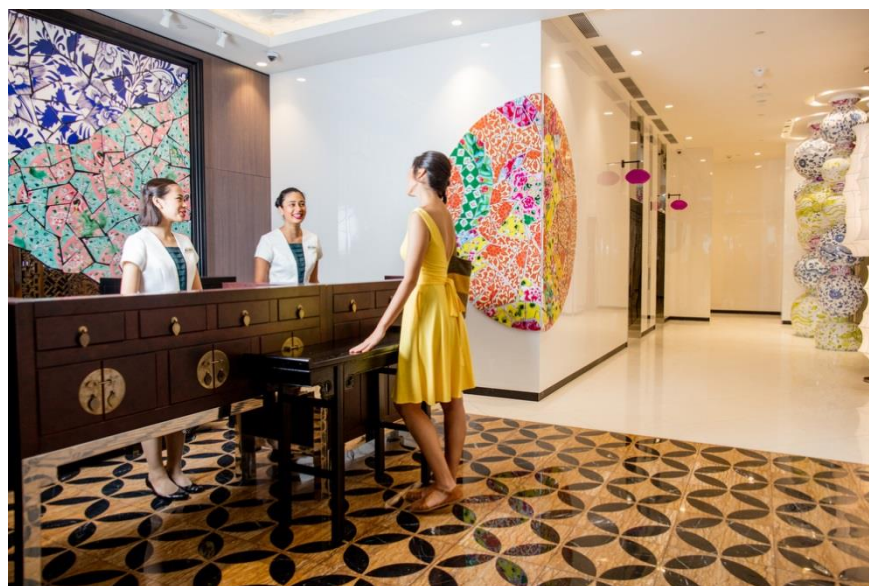
写真： ホテル インディゴ シンガポール カトン (ロビー)

※本ニュースリリースは、2015年7月5日にIHGが発表したニュースリリースの抄訳版です