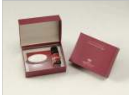
ANA クラウンプラザホテル オリジナル・アロマキット