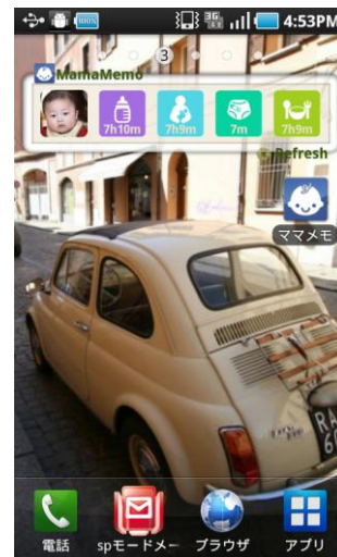
ウィジェット表示