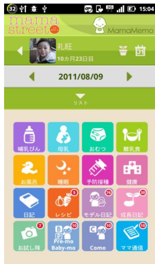
わかりやすい Menu 画面