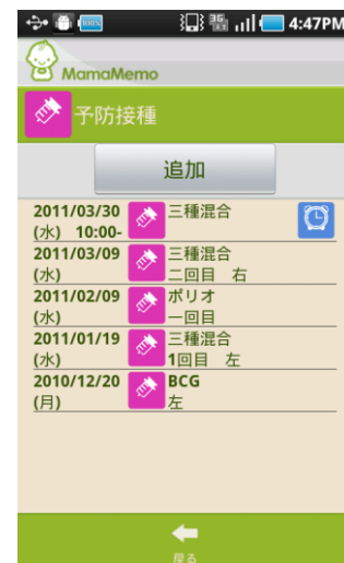
無駄な操作を極力抑え直感的な入力が可能