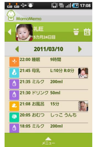
日別で見ると一目瞭然

メニューはそれぞれ哺乳びん、母乳、おむつ、離乳食、お風呂、睡眠、予防接種、健康、日記の9項目から選択できます。それぞれのメニューでは、各項目への入力が非常にスムーズに行える作りになっています。また、記録した項目を日別・月別でそれぞれ確認することができるので、前回はいつミルクをあげたのかをチェックしたり、ひと月の間でのミルクの増減をチェックするなど、過去の育児記録を簡単に確認することができます。