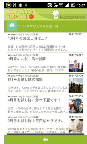
主婦の友社のデジタルコンテンツも充実