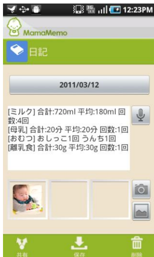
3つまで写真登録可能

また当アプリには、その日に入力した項目をすぐ確認したり、記録を追加できるようにウィジェット機能も搭載しておりますので、待受画面からアプリに直接アクセスすることができます。