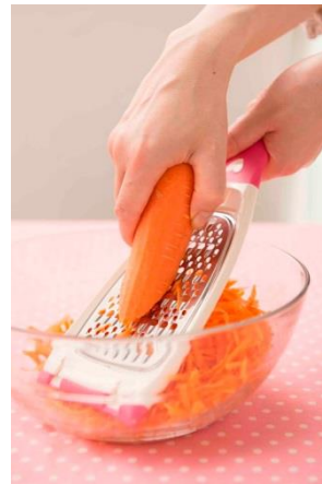
(左) 表紙 (中) スピードサラダおろし 本体 ピンクのカラーと、心のマークがオリジナル (右) 上から下におろすときに力をいれると気持ちよくすりおろせます

株式会社主婦の友社は、11月21日（木）、「ヒルナンデス！」や「スマステーション!!」など人気番組で紹介され話題の野菜おろし器を、ピンクのオリジナルカラーにして付録に付けたレシピ本『「スピードサラダおろし」つき 1日分の野菜がラクラクレシピ』を発売いたしました。