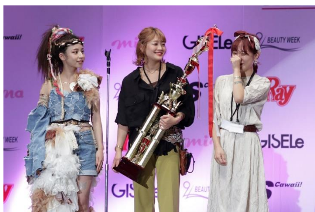
(写真左) GLOWING BATTLE for Studentの様子 (写真右) GLOWING BATTLE for Student 優勝の3人