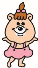
CHIBIKO 『チビコ』 3人の中で 一番のお姉さん