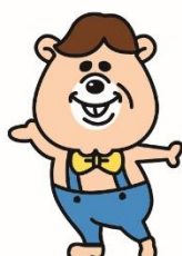
PAPATAN 『パパタン』 クマタンのお父さん ママが大好き おしゃれ