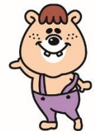
BUSATAN BROTHER 『ブサタン弟』