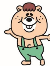
BUSATAN 『ブサタン』 ∴ 兄弟