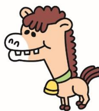
ROBATAN 『ロバタン』 クマタンが犬だと思って 拾って来て、成長したら ロバだったが 責任持って飼っている