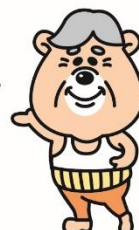
JIJITAN 『ジジタン』 クマタンのおじいちゃん ジジタンは入れ歯