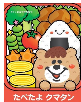
『たべたよクマタン』