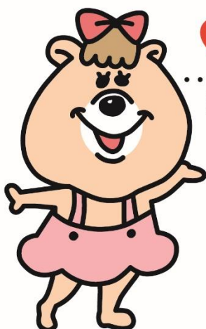
KANOJYO 『クマタンの彼女』 クマタンと いつも一緒