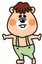
CHIBITA 『チビタ』 泣きむし