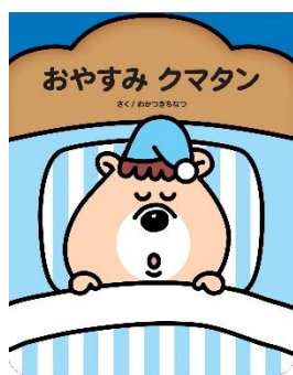
『おやすみクマタン』