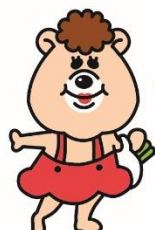
MAMATAN 『ママタン』 クマタンのお母さん お料理好き