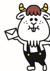
YAGITAN 『ヤギタン』 クマタンちのポストの手紙を いつも勝手に食べちゃう