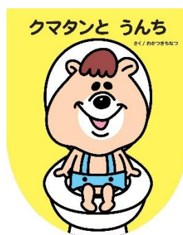
『クマタンとうんち』