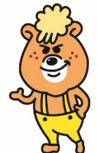
CHIBISUKE 『チビスケ』 彼だけ誰にも 似ていない