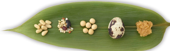
※ページ見本は制作途中のもので、一部変更があります。

忍者の術・技、武器、衣食住、歴史…実際に外国人に「忍者の何を知りたいか」取材し、その内容を盛り込みました。