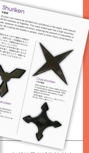
※伊賀流忍者博物館 協力