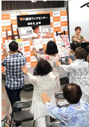
▲昨年のイベントの様子

敬老の日に向け、「寝たきりゼロ」「介護予防」のためのセルフケアとしての「ひざ裏のばし」や、川村明医師の取り組みをぜひ、ご取材ください。