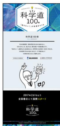
「科学道 100 冊」ホームページ