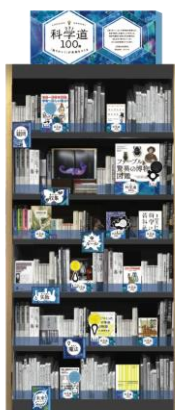
「科学道 100 冊」書棚イメージ

「科学道100冊」は、未知に挑戦しながら未来を切り開いていく科学者の姿勢や方法に着目し、すべての人の生きるヒントになる本との出会いを目指します。前に進みたいと考えている人が勇気と方法を得るために、知りたい気持ちから未来をひらく科学者たちの見方・生き方・考え方が参考になると考え、科学者の思考プロセスを6つのテーマで切り分け、それぞれのテーマに沿った書籍を選び出しました。選び抜かれた100冊は、本日開設するフェア特設サイト( http://kagakudo100.jp/ )にてご覧いただけます。また、提携書店では期間中、フェアのオリジナルキャラクターのしおりとブックレットを選書購入者にプレゼントします。