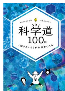
「科学道100冊」ブックレット