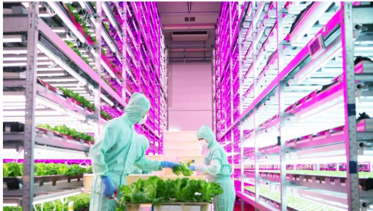
MIRAI 株式会社の植物工場（多賀城工場）の様子